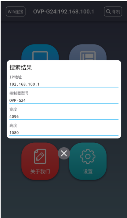
搜索结果为当前连接设备